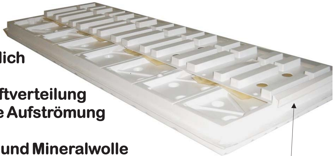
Umlaufendes Nut- und Feder-Stecksystem